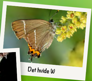
Det hvide W

Ligesom andre sommerfugle kan det Hvide C smage med fødderne, om det fx er en lækker nedfaldsfrugt, den er landet på. Også andre sommerfugle har bogstav-navne, fx Det Hvide W.