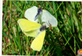
Han- og hun-citronsommerfugle

De ses allerede i marts, for de har overvintret som voksne, og kan endda klare frost. I det tidligere forår, søger de en mage, så man kan tit se en hvid og en gul sommerfugl lege fangeleg. Den grønne larve sidder helt stille på Tørst-blade og er svær at se.